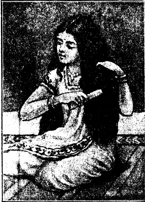
चित्र १—बालों की सफ़ाई

चाहिए। बाल झाड़ने से उनका मैल निकल जाता है और वे सुलभ जाते हैं। ब्रुश फेरने से भी बाल साफ हों जाते हैं।